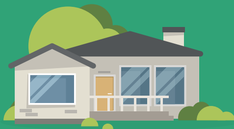
Uma economia residencial

Economia: Unidade autônoma ou conjunto de unidades autônomas de um imóvel atendidos pela coleta de lixo. Exemplo: casa, apartamento, salas comerciais, unidades comerciais e industriais.